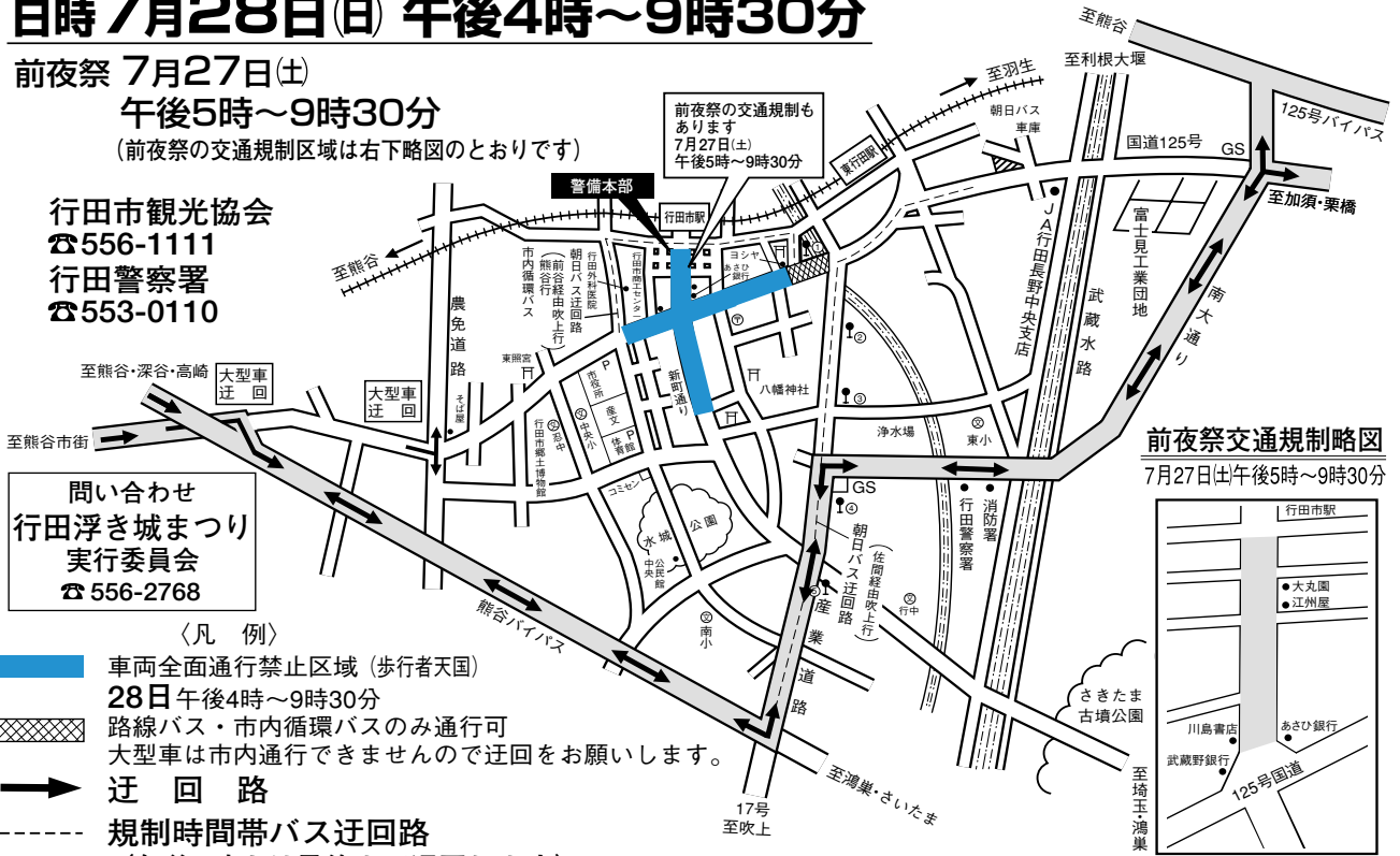
前夜祭交通規制略図 7月27日(土)午後5時～9時30分