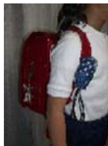
いざという時、すぐ紐を引けるように工夫しましょう

大人でも、びっくりした時にはなかなか声が出ないものです。 そんな時、防犯ブザーが役に立ちます。犯罪者は、『音』と『光』を嫌います。 外出するときは、ハンカチやティッシュを必ず持つように、防犯ブザーをいつも持っているようになると良いと思います。(電池切れもチェックしておきましょう。) また、どこで誰と遊ぶのか、何時に帰宅するのかを必ず言うてから出かけるように指導しましょう。家人の留守中に出かける場合には、伝言メモを置くようにします。