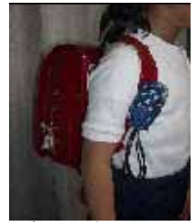
いざという時のために すぐに手の届く位置につける

また、どこで誰と遊ぶのか、何時に帰宅するのかを必ず言うてから出かけるように指導しましょう。家人の留守中に出かける場合には、伝言メモを置くようにします。（電池切れもチェックしておきましょう。）