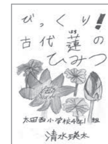
清水瑛太さんの作品